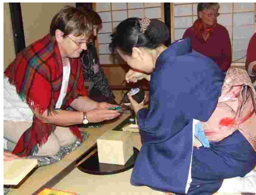
Cérémonie du thé

La porcelaine spécifique à cette région nous a été montrée dans sa dimension de décoration sur émail à travers la visite du centre de formation céramique d'Utasuyama. Centre très intéressant par l'accueil particulier qu'il propose aux céramistes déjà installés et par la mise à disposition d'ateliers relais.