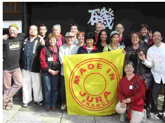
Céramistes de Kasama

L'accueil des céramistes, dont certains sont déjà venus en France, fut extraordinaire. Attentifs à la présentation de nos productions, ils ont su aussi nous ouvrir leur atelier et répondre à nos questions techniques.