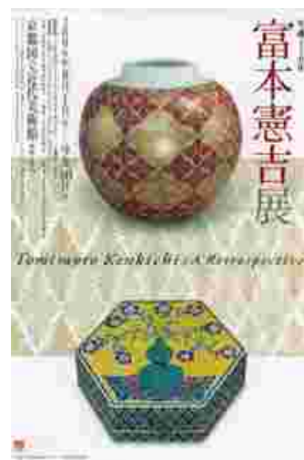
Retrospective Tomimoto Kenkichi