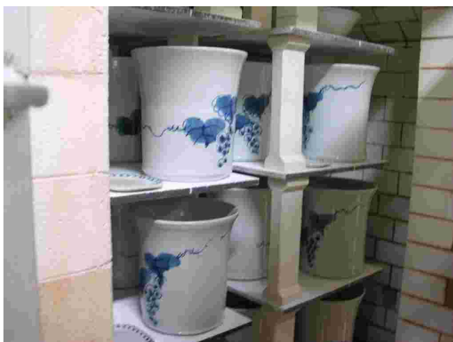
Location d'atelier et four pour un céramiste extérieur

La porcelaine spécifique à cette région nous a été montrée dans sa dimension de décoration sur émail à travers la visite du centre de formation céramique d'Utasuyama. Centre très intéressant par l'accueil particulier qu'il propose aux céramistes déjà installés et par la mise à disposition d'ateliers relais.