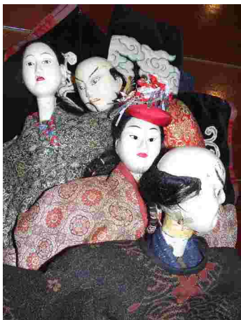
Théâtre de marionnettes