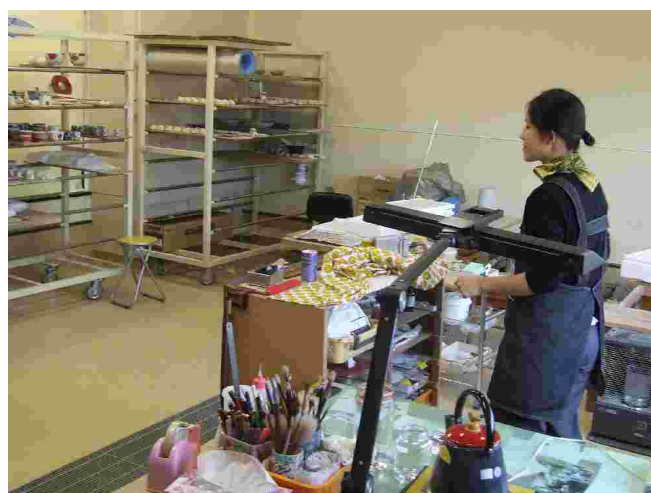
Jeune céramiste en atelier relais