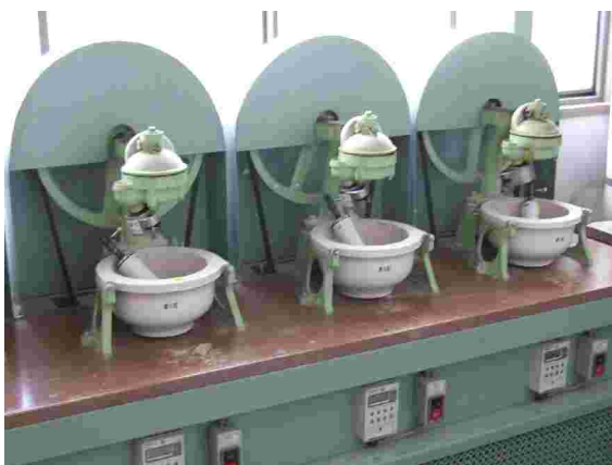
Centre de recherche de Shigaraki

Le centre de formation et de recherche de Shigaraki nous a montré l'intérêt des japonais pour la céramique et cela fut confirmé par nos visites d'autres centres de formation initiale ou continue.